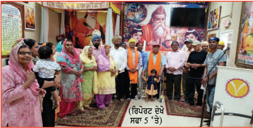
(ਰਿਪੋਰਟ ਦੇਖੋ ਸਫਾ 5 'ਤੇ)