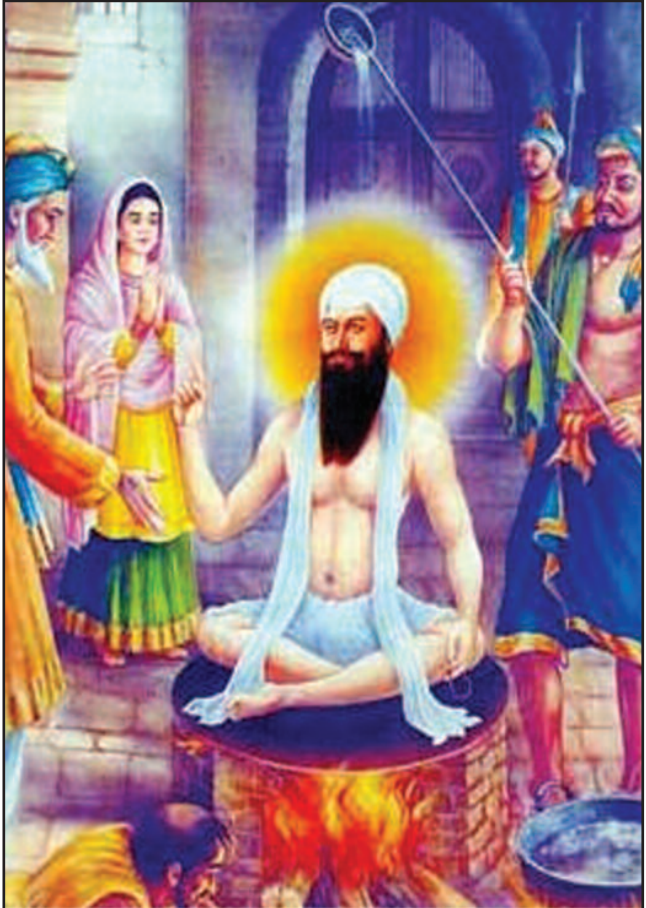
ਪੰਜਵੀਂ ਪਾਤਸ਼ਾਹੀ ਸਾਹਿਬ ਸ੍ਰੀ ਗੁਰੂ ਅਰਜਨ ਦੇਵ ਜੀ ਦੀ ਮਹਾਨ ਸ਼ਹਾਦਤ ਨੂੰ ਅਦਾਰਾ 'ਦੇਸ਼ ਦੁਆਬਾ' ਵੱਲੋਂ ਕੋਟਿ-ਕੋਟਿ ਪ੍ਰਣਾਮ।

ਮੁੱਖ ਸੰਪਾਦਕ : ਪ੍ਰੇਮ ਕੁਮਾਰ ਚੰਬਰ ਸੰਪਰਕ : 916-947-8920 ਫੈਕਸ : 916-238-1393 E-mail : deshdoaba@yahoo.com ਸੰਪਾਦਕ : ਤਰਸੇਮ ਜਲੰਧਰੀ