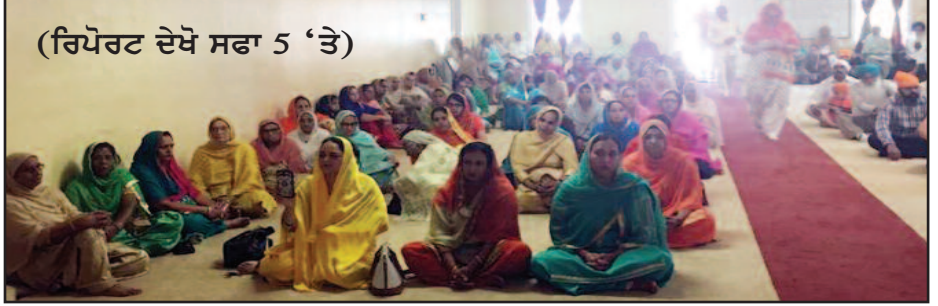
(ਰਿਪੋਰਟ ਦੇਖੋ ਸਫਾ 5 'ਤੇ)